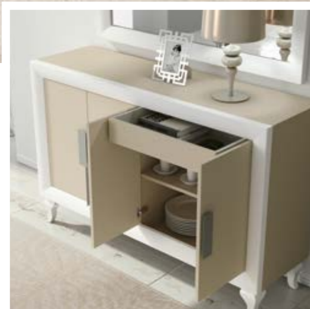
2024 Aparador 150 x 40 x 961 2029 Marco espejo 130 x 4 x 901