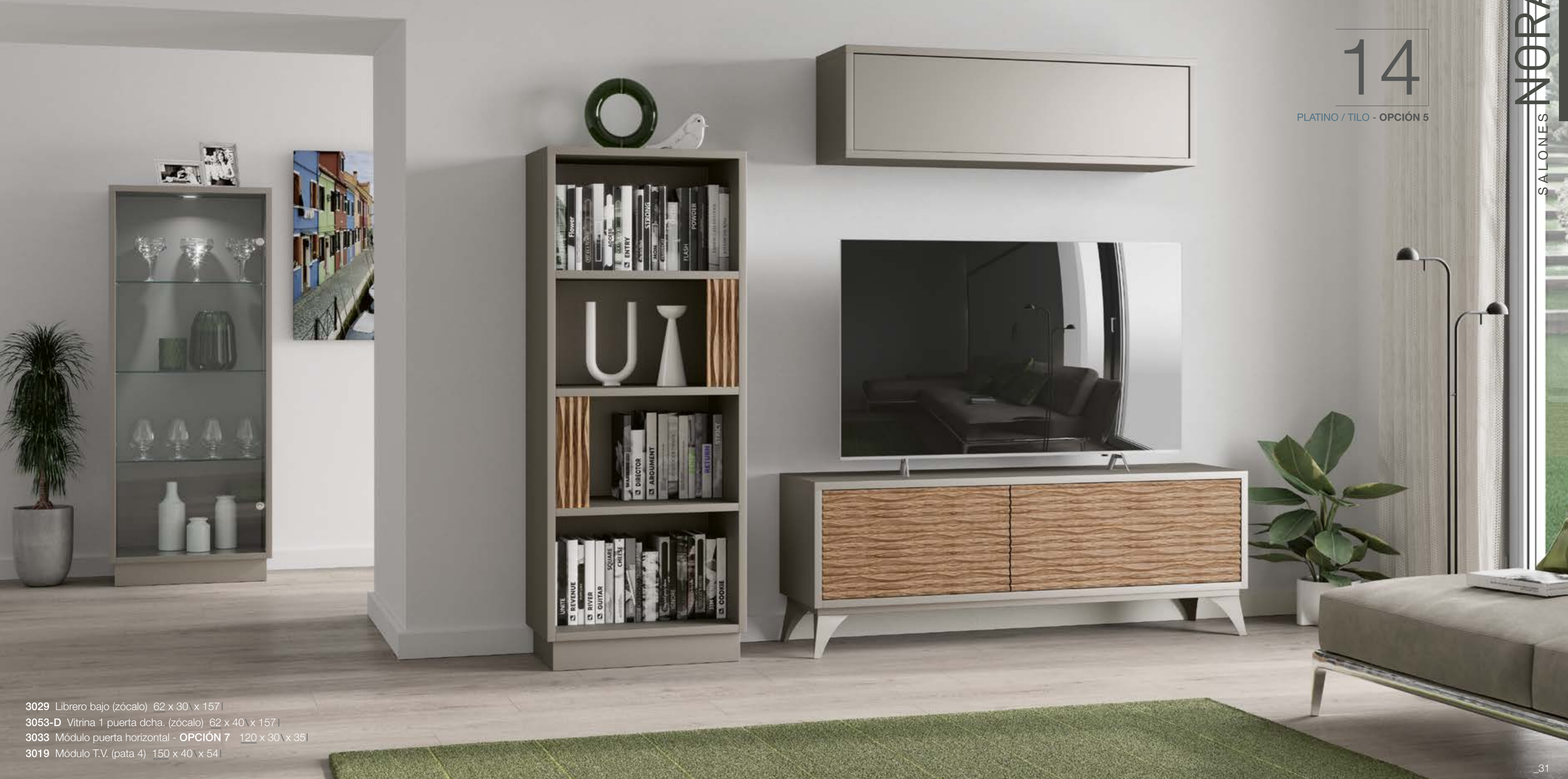
3029 Librero bajo (zócalo) 62 x 30 x 157 |