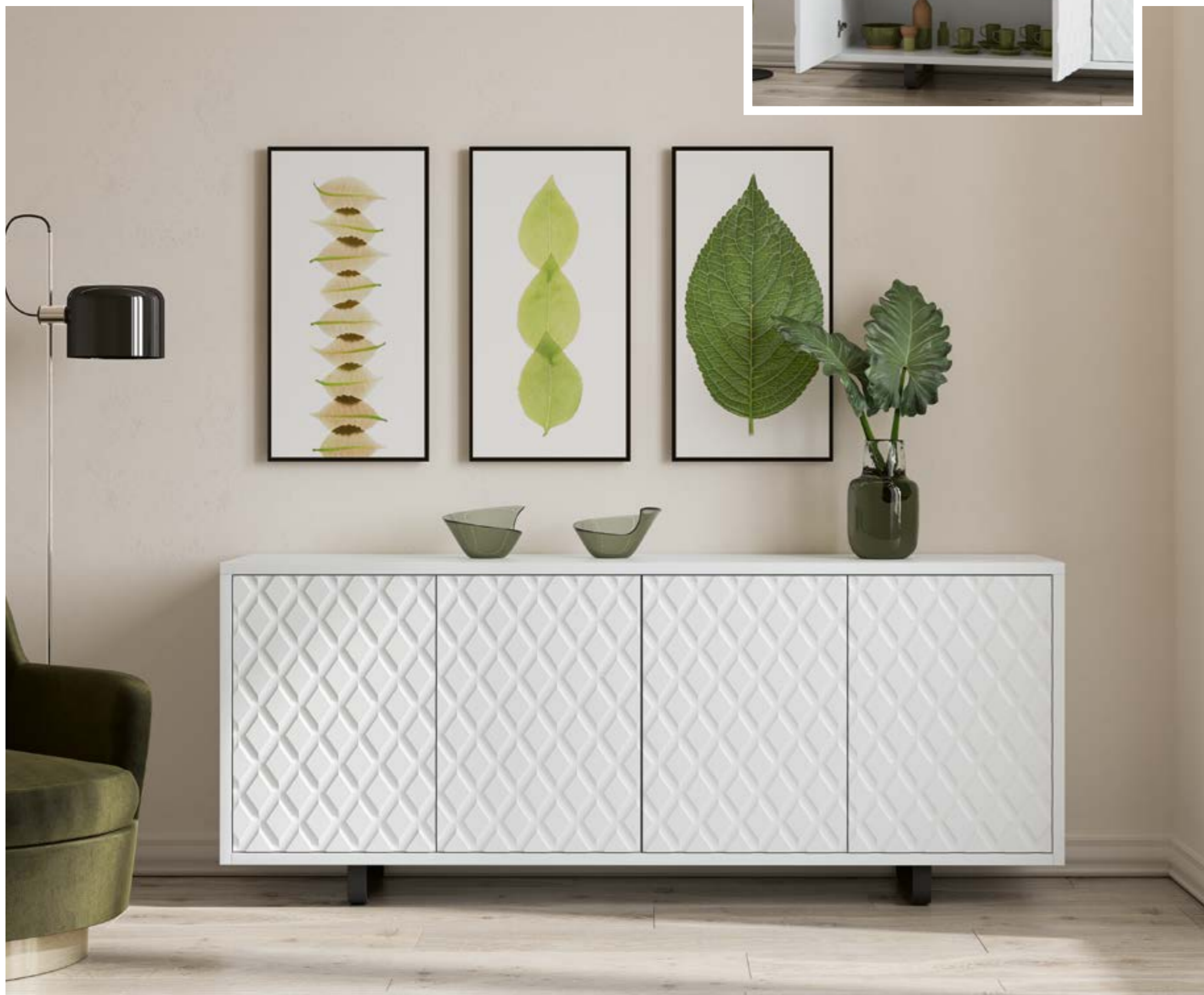
3052 Aparador (pata 3) 180 x 40 x 741