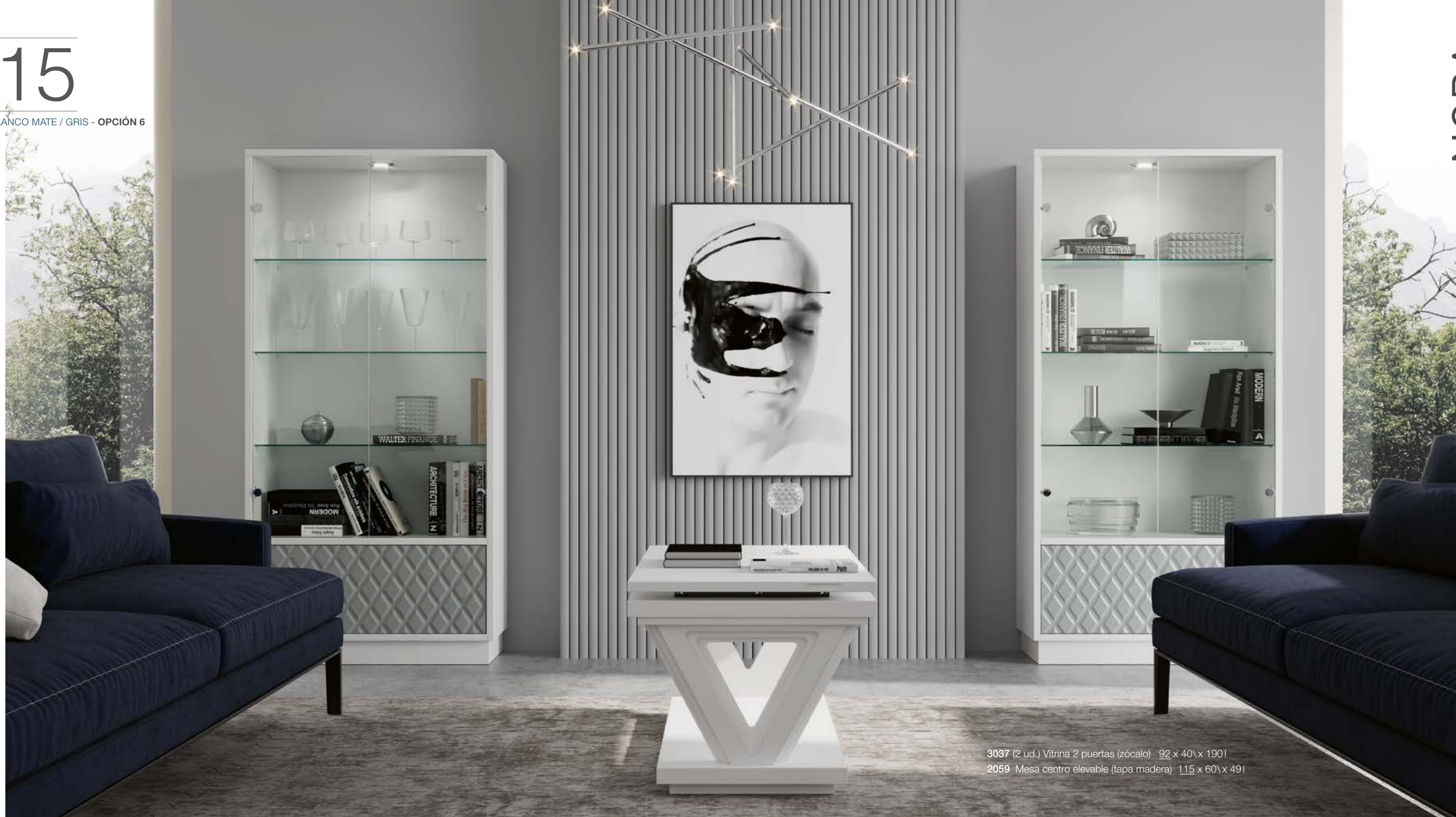
3037 (2 ud.) Vitrina 2 puertas (zócalo) 92 x 40\ x 190l 2059 Mesa centro elevable (tapa madera) 115 x 60\ x 49l