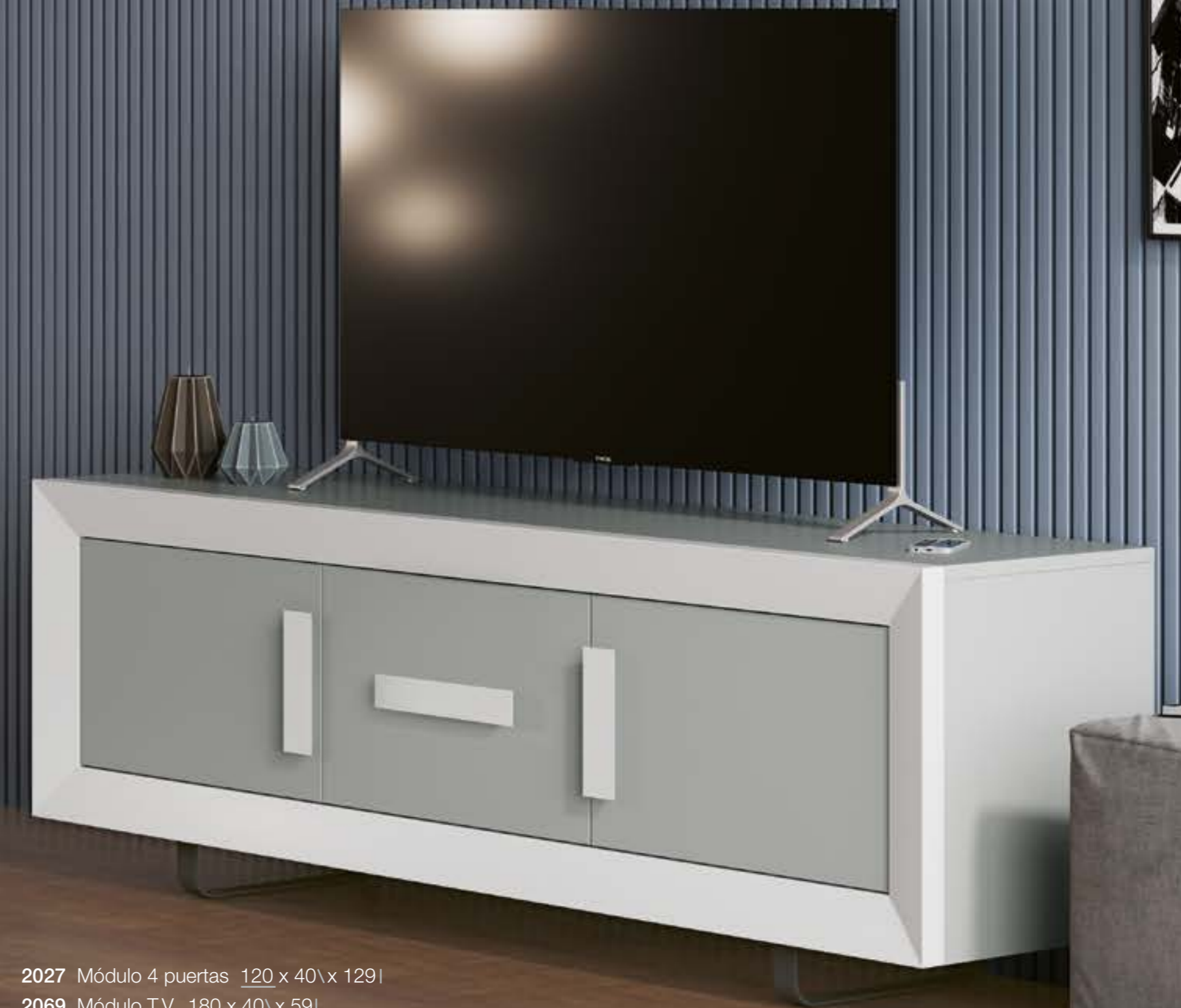
2027 Módulo 4 puertas 120 x 40 x 129l 2069 Módulo T.V. 180 x 40 x 59l